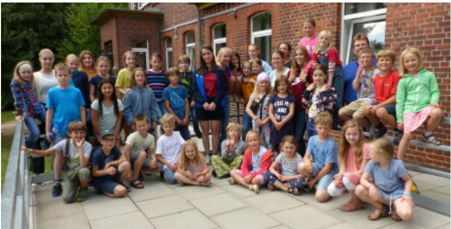
Chorfreizeit des Kinderchores zum Musical "Der kleine Tag" mit Team

Einlass zu dieser Aufführung ist ab 16 Uhr. Der Eintritt ist frei. Am Ausgang wird für die Finanzierung der Aufführung gesammelt.